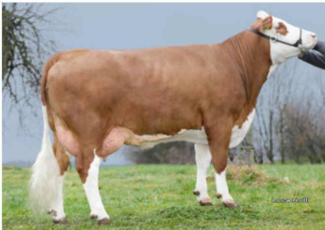
Kewana, Mutter von Erzherzog Berger Alfred, Miederkingen

FLEISCH Nettozunahme 113 Ausschlachtung 108 Handelsklasse 102