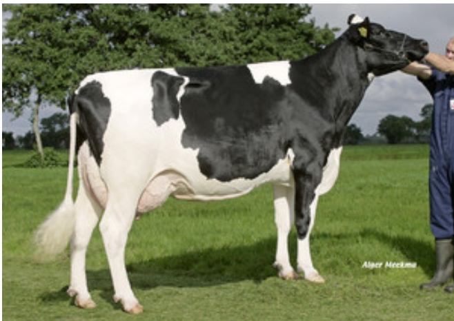
ETAZON RENATE, Urgroßmutter von Snowdrop PP