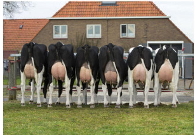
6 Atlantic-Tö. Betrieb WC Faber, Wijnjewoude