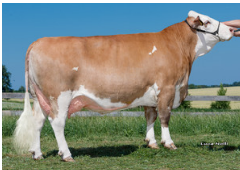
Germany 1. Kalb Schürer-Hammon GbR, Oettingen